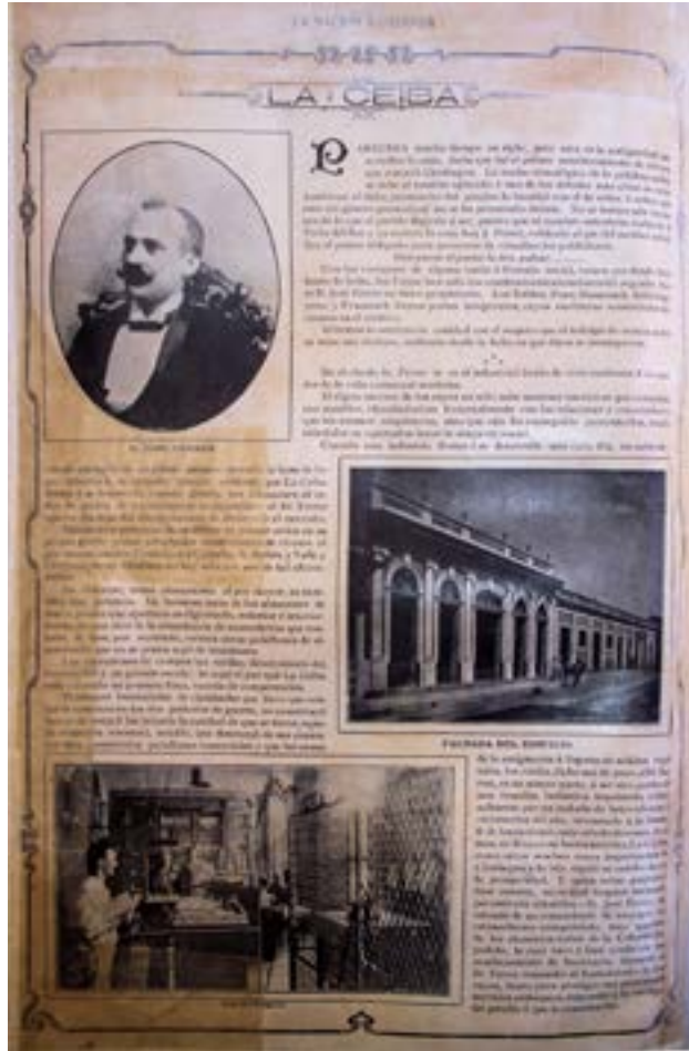
La Ceiba. Revista La Nación Ilustrada, 1909. Nótese el nuevo edificio en primer plano.

“La esquina de las calles Santa Isabel y Argüelles, merece una lápida conmemorativa... está en ella el exponente mercantil de más valor histórico de la ciudad de Cienfuegos.”