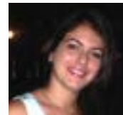
Ana L. Barrera Diseño y realización

Todos los números de la revista Bitácora de Jagua están disponibles en el sitio web de la Oficina del Conservador de la Ciudad de Cienfuegos.